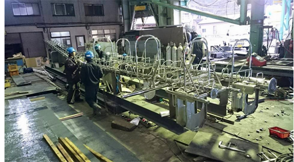
研磨ステンレス 船首マスト・レーダーマスト